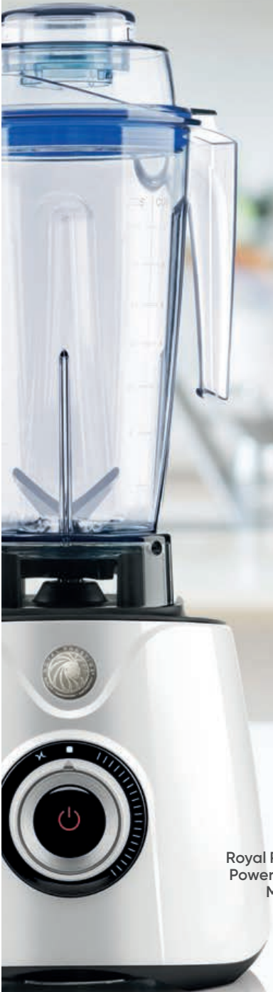
Royal Prestige® Power Blender Max