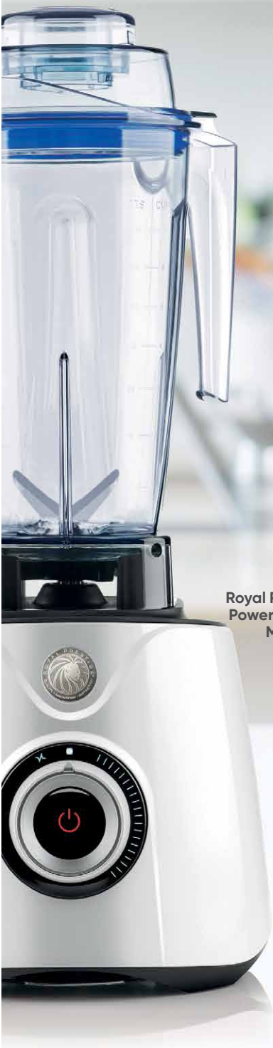
Royal Prestige® Power Blender Max