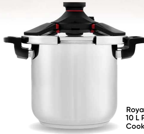
Royal Prestige® 10 L Pressure Cooker

Ideal para cocinar en estas fiestas y el resto del año!