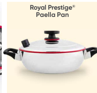
Royal Prestige® Paella Pan