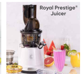
Royal Prestige® Juicer