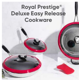
Royal Prestige® Deluxe Easy Release Cookware