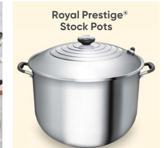
Royal Prestige® Stock Pots