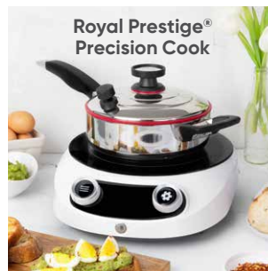
Royal Prestige® Precision Cook