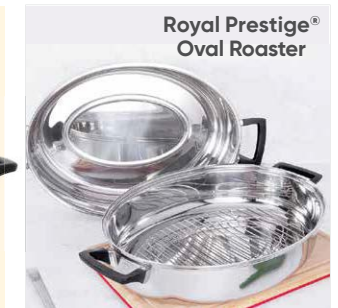
Royal Prestige® Oval Roaster