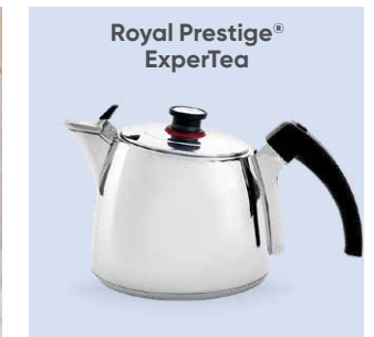
Royal Prestige® ExperTea