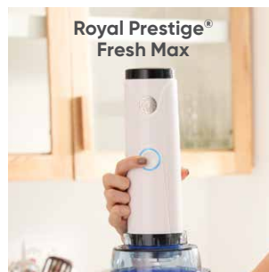
Royal Prestige® Fresh Max

Conoce nuestro catálogo completo en royalprestige.com