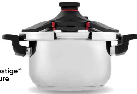
Royal Prestige® 6 L Pressure Cooker

Recupera ese aire de confianza en tu cocina con las Ollas de Presión de Royal Prestige® y sus cuatro mecanismos de seguridad.