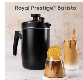
Royal Prestige® Barista