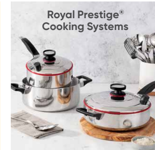
Royal Prestige® Cooking Systems