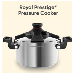
Royal Prestige® Pressure Cooker