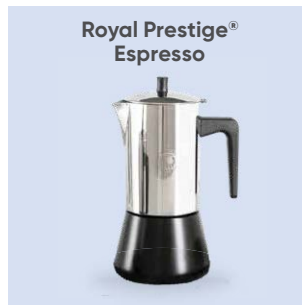
Royal Prestige® Espresso