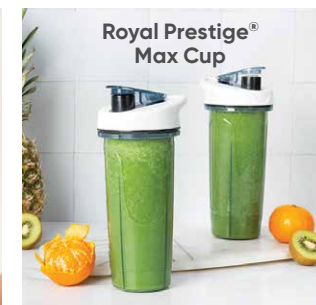
Royal Prestige® Max Cup