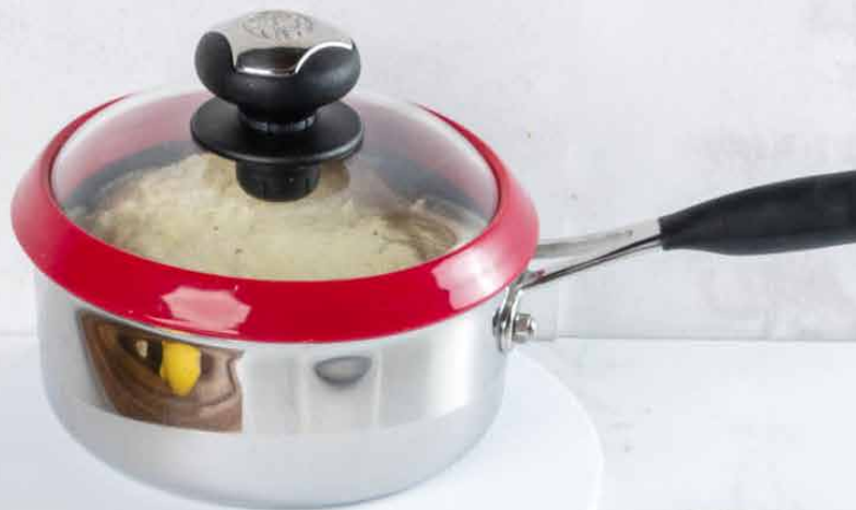
Royal Prestige® Deluxe Easy Release 2 QT Saucepan