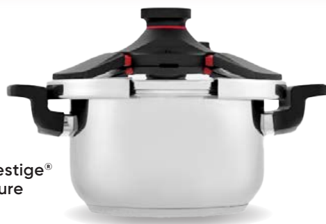
Royal Prestige® 6 L Pressure Cooker

Recupera ese aire de confianza en tu cocina con las Ollas de Presión de Royal Prestige® y sus cuatro mecanismos de seguridad.