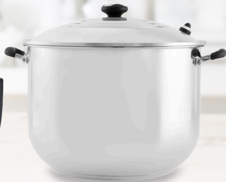
Royal Prestige® Stock Pot