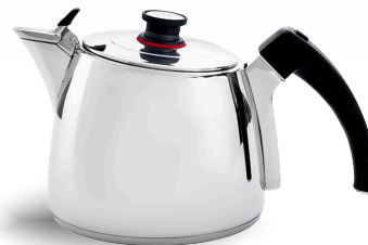
Royal Prestige® ExperTea