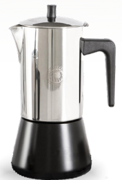
Royal Prestige® Espresso