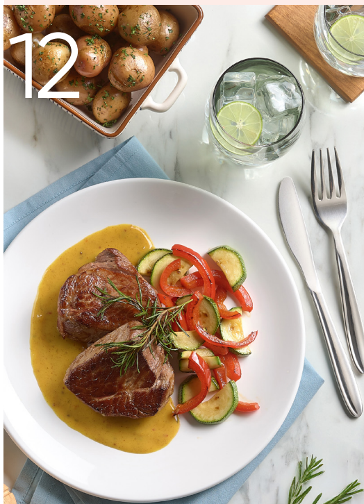
Medallones de res en salsa de mostaza