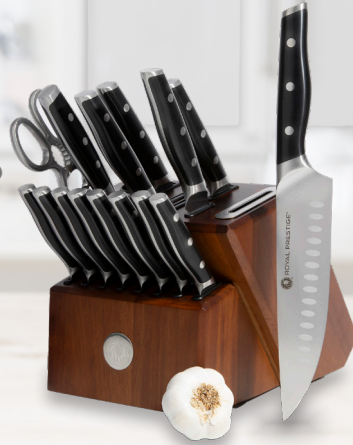
Royal Prestige® All-in-One Knife Block