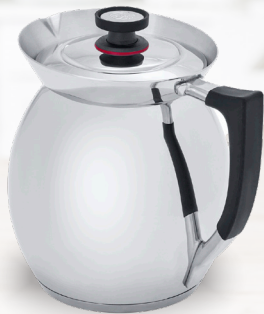
Royal Prestige® Chocolatera