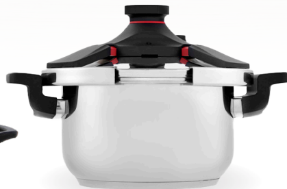
Royal Prestige® Pressure Cooker