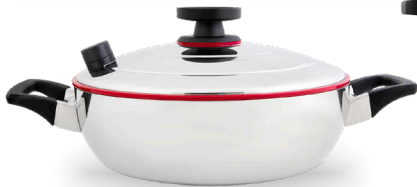
Royal Prestige® Paella Pan