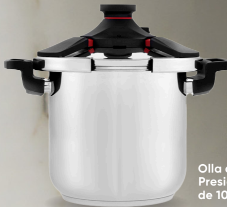
Olla de Presión de 10 L