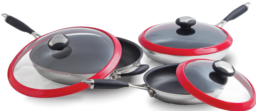
Royal Prestige® Deluxe Easy Release Skillet Set