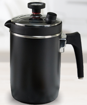
Royal Prestige® Barista