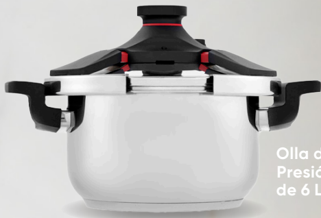
Olla de Presión de 6 L