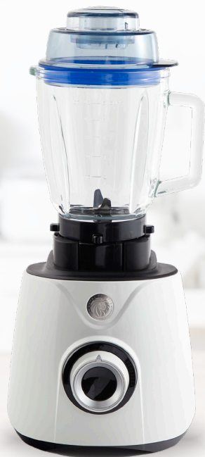
Royal Prestige® Power Blender Max