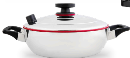
Royal Prestige® Paella Pan