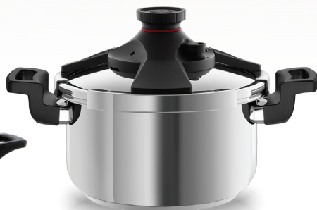
Royal Prestige® Pressure Cooker