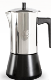
Royal Prestige® Espresso