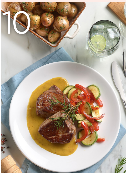
Medallones de res en salsa de mostaza

Sabores que inspiran, recetas creadas para encuentros especiales y bienestar que se disfruta en familia.