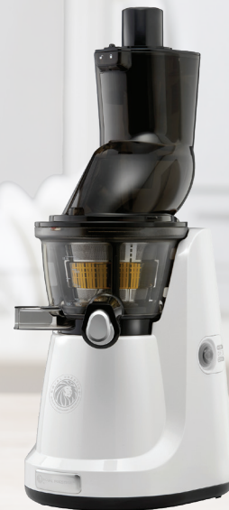
Royal Prestige® Juicer