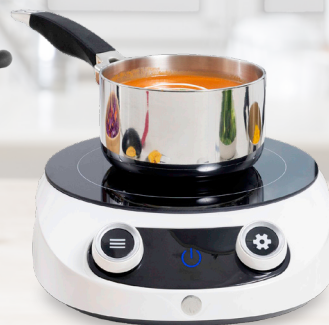
Royal Prestige® Precision Cook