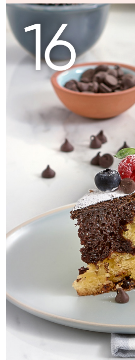
Torta de y choc